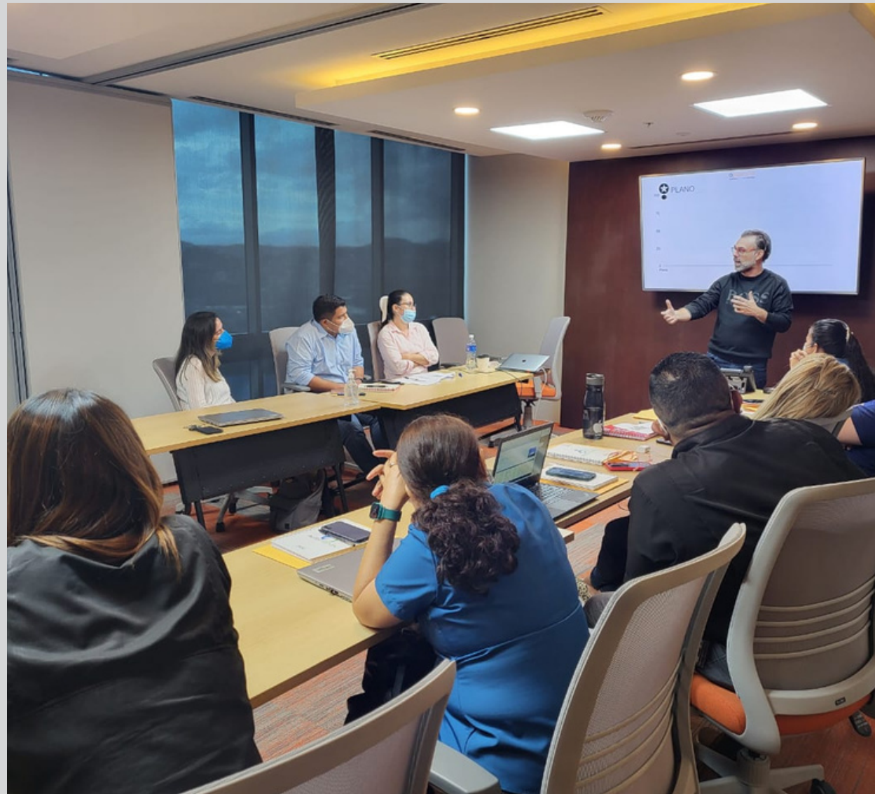
Sesión Formativa Salvatore Ferragamo, México (Julio 2022)