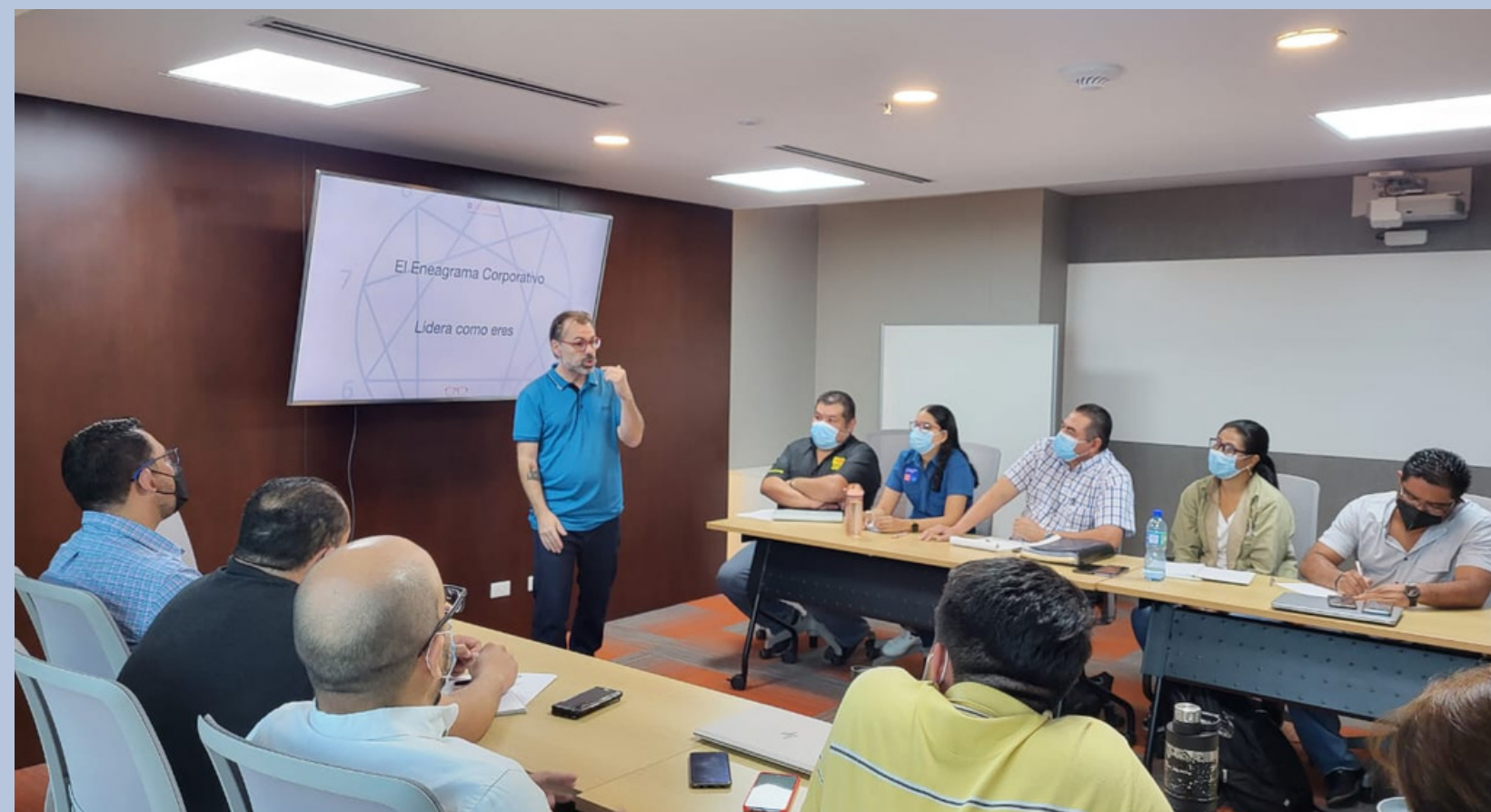
Eneagrama Corporativo, Nestlé El Salvador (2021)

En los últimos años he visto crecer de manera exponencial la demanda de organizaciones que apuestan por un liderazgo más humano.